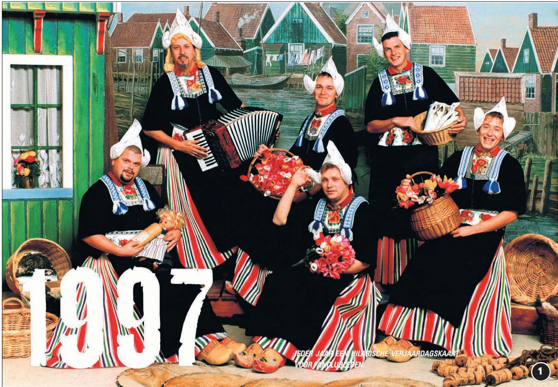
Foto 1: Fanclub-leden krijgen ieder jaar een bijzondere verjaardagskaart (1997).